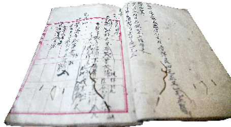
郭家皮行光绪十六年的账本。

咸丰末年，由于捻军袭扰，直接影响“南皮都”周家口的牲畜交易，皮货交易出现衰败。从郭家皮行光绪十五年